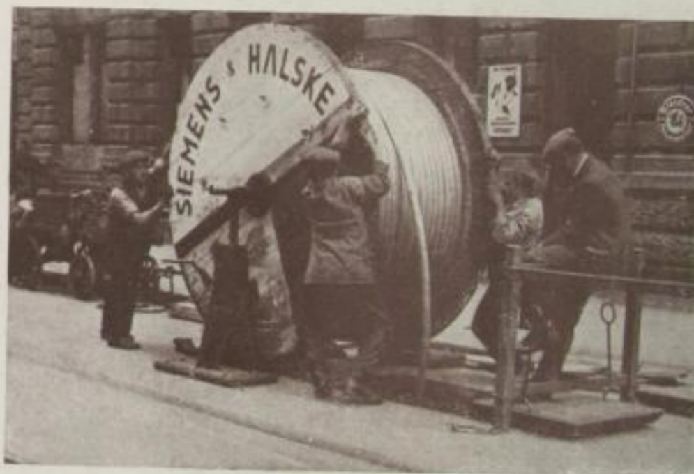
Wo drei arbeiten, darf der Aufpasser nicht fehlen

Wir finden des öfteren Negative, auf denen ganz deutlich Schriftzüge sichtbar sind, und zwar sind diese Schriftzüge meist auf dem Negativ schwarz und auf der Kopie hell. Ihre Ursache ist eine Druckerscheinung auf