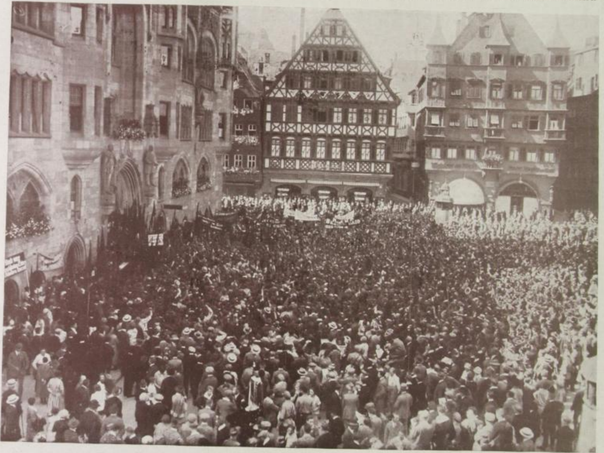
Kundgebung des Kommunistischen Jugendverbandes

darüber entscheiden. Man vergleiche diese beiden hier wiedergegebenen Aufnahmen, die vom gleichen Standpunkt aus gemacht worden sind, und jeder wird folgendes bemerken: Bei der Aufnahme der sozialdemokratischen Kundgebung wurde der Apparat höher und nach rechts gerichtet, während er bei der kommu-