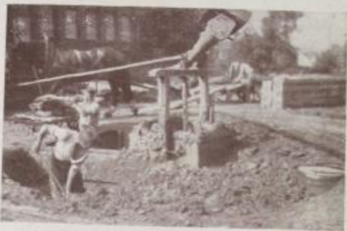
Lehmmühle in der Ziegelei