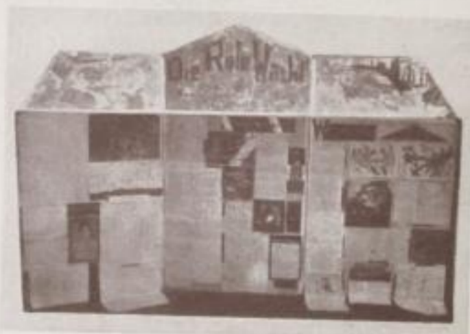
Wandzeitung der RJF. R. K., Hamburg

schwierig. Es gehört ein guter Geschmack und eine Portion Feingefühl dazu, eine natürliche, ungekünstelte Haltung des Objektes zu erreichen. Auch muß die Belichtung sehr genau abgeschätzt sein, um den sogenannten Fleischton richtig wiederzugeben.