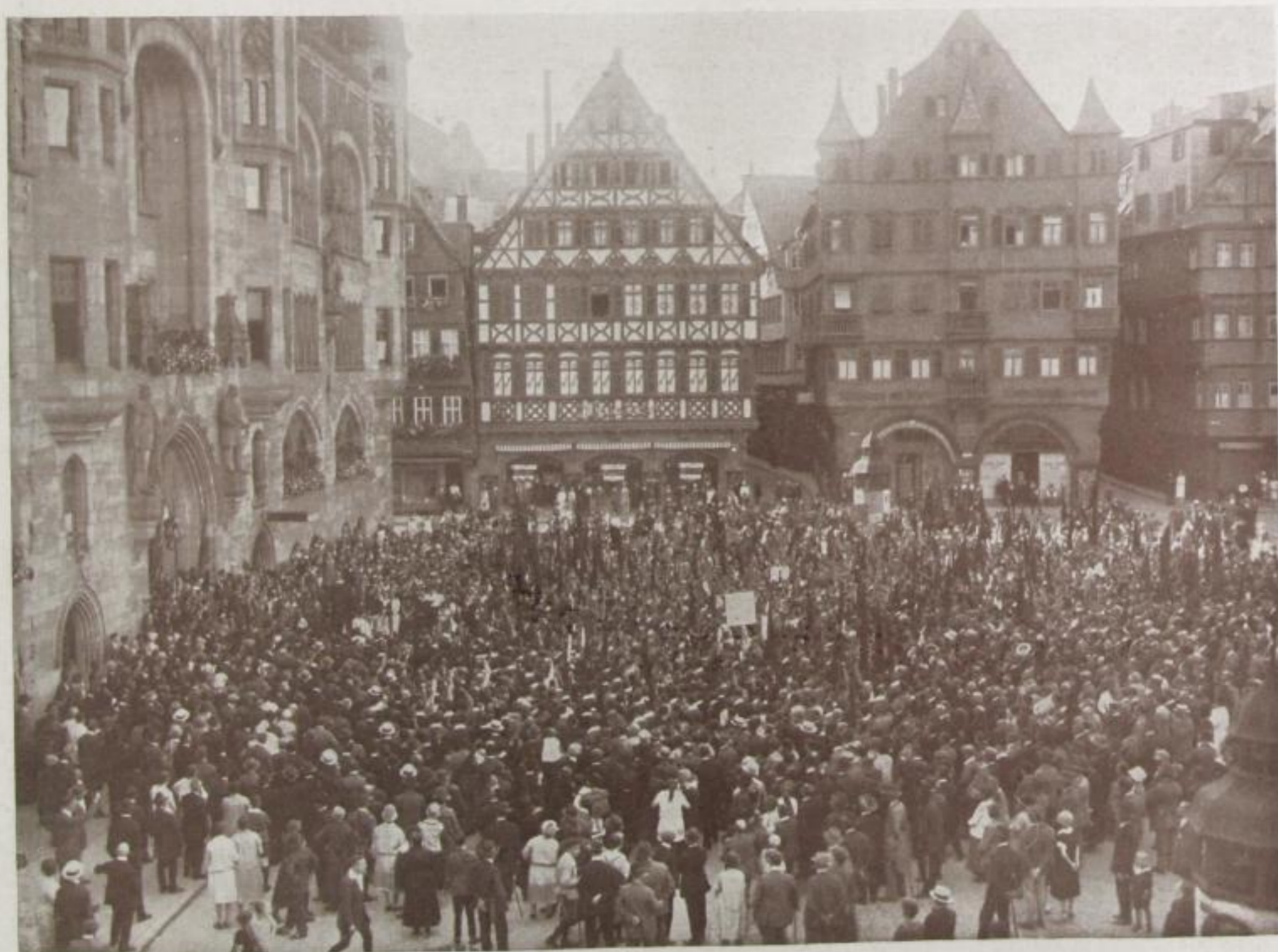
Kundgebung der Sozialistischen Arbeiterjugend

Gauen Deutschlands und viele aus dem Ausland hier zusammengekommen waren. Während die Vertreter der Sozialistischen Jugendinternationale ungehindert zu den Jugendlichen reden konnten, wurden die ausländischen Delegierten der kommunistischen Jugendverbände von der Polizei unnützerweise schikaniert und durften nicht sprechen. So erfolgten bei den Vertretern von Frankreich, Belgien, Tschechoslowakei, Schweiz, England, Oesterreich, Norwegen und Schweden Haussuchungen; man schleppte sie sogar zur Polizei, um ihre Papiere zu kontrollieren.