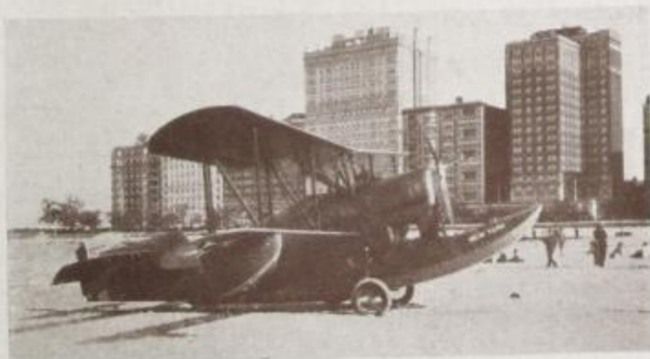
Wolkenkratzer und Riesen-Flugzeug

des Bildformates ist es zweckmäßig, dieses Untergrundpapier zwei bis fünf Millimeter über die Begrenzung der Bilder hervorheben zu lassen. Für künstlerisch wirkende Mattbilder wird heute ausschließlich in der geschilderten Weise verfahren. Die Bilder werden nur an den Ecken aufgeklebt, und zwar in trockenem Zustande, während man bei Vollaufziehen der Bilder solche in feuchtem Zustande aufzieht.