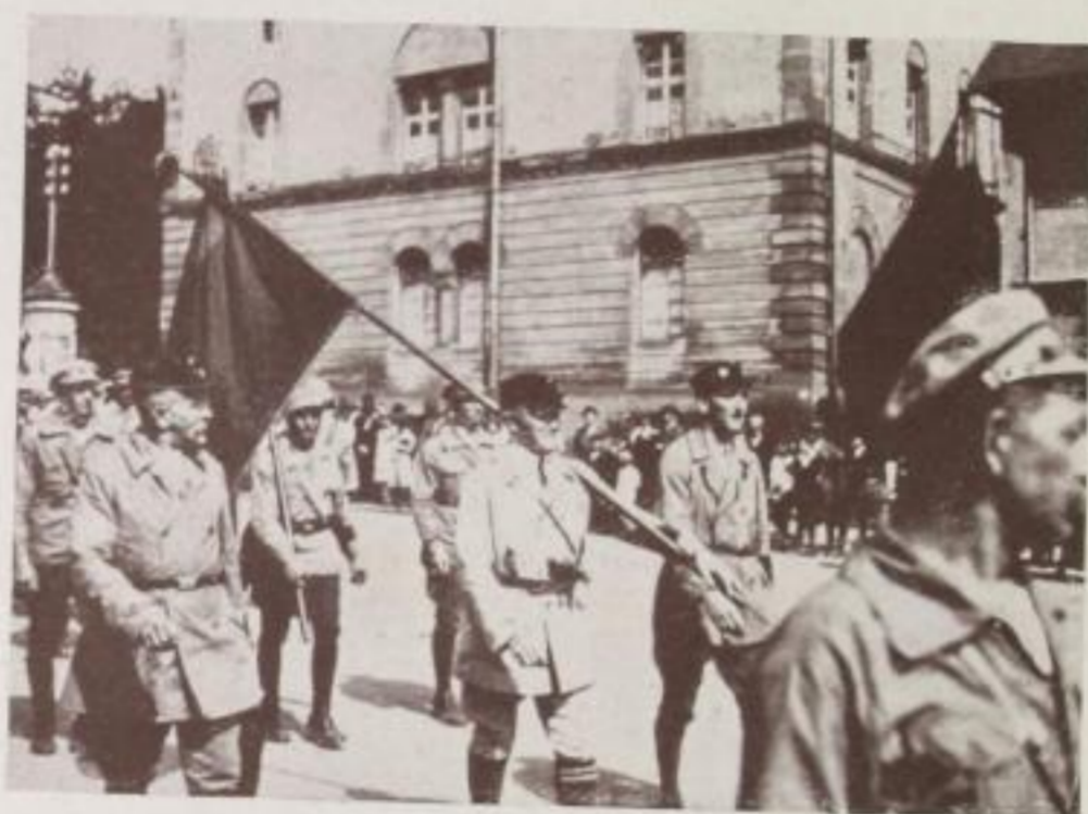
Rote Frontkämpfer und Reichsbanner demonstrieren gegen den Krieg E. H., Stuttgart

N egative, welche nach der Entwicklung ungleichmäßige Flecken in verschiedener Größe und Form zeigen, sind häufig durch ungleichmäßiges Überspülen mit Entwicklerflüssigkeit verdorben worden. Man achte darauf, daß man nicht zu wenig Entwicklerflüssigkeit verwendet, da hierdurch diese sogenannten Entwicklerflecke entstehen. Die Ent-