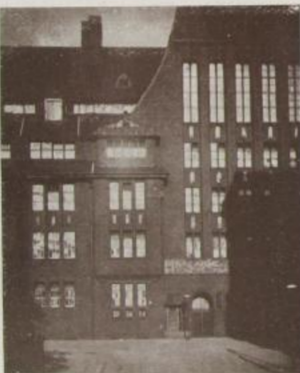
Keksfabrik Bahlsen T., Hannover

August, 10 Uhr vorm. Apl. 1:8, Bl. 8, Tageslicht 1 Sek., Chromo-Isorapid