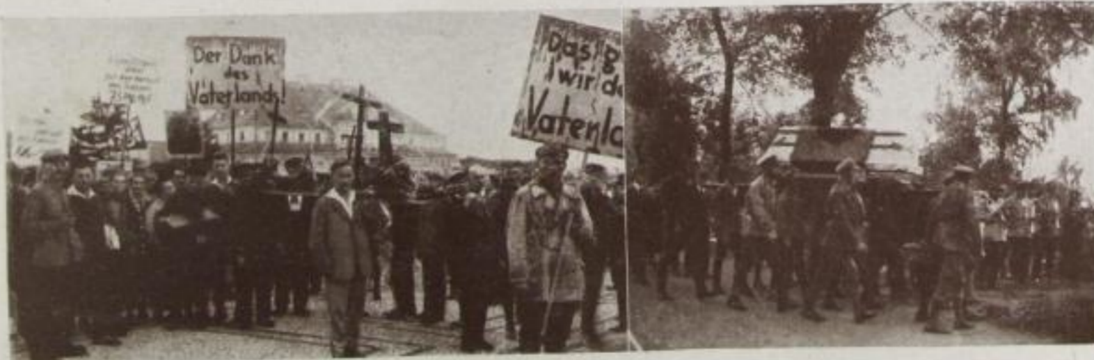
Antikriegskundgebung F., Dresden

Antikriegskundgebung und Auf starken Schultern. Auf dem ersten Bild ein Demonstrationzug, wie er nicht