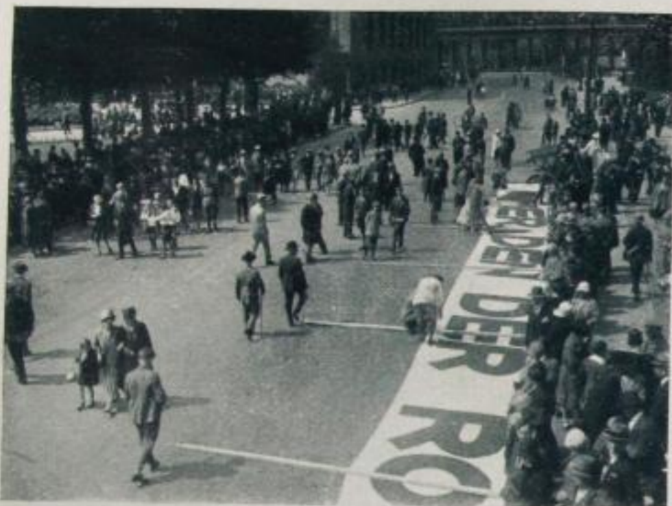
Vorbereitung zur Demonstration