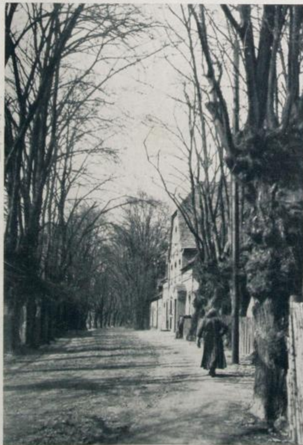
Allee mit Gasthof