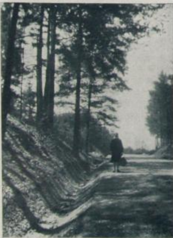
Heim vom Einkauf

Heim vom Einkauf. Der Titel des Bildes von St. H., Reichenberg i. B., ist allerdings nicht ganz zutreffend, denn hier steht nicht die Figur im Vordergrund des Interesses, sondern sie dient nur als Staffage. Das gut gesehene Motiv wirkt besonders reizvoll durch die