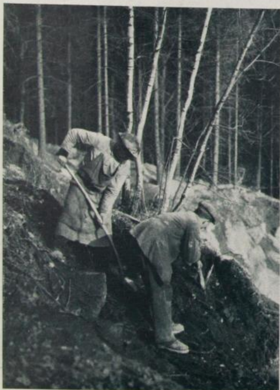
67 Pfennig Stundenlohn

Je nachdem der Himmel bedeckt ist oder die Sonne scheint, wählt man die kürzere oder längere Belichtungszeit. Früh beginnt man mit der längsten, also \frac{1}{5} , um im Laufe des Tages über alle angegebenen Zeiten hinweg am Abend wieder mit \frac{1}{5} oder \frac{1}{10} aufzuhören. Bei Vordergrundaufnahmen, wo es auf gute Durchzeichnung ankommt, nimmt man Bl. 6,3, bei Fernsichten Bl. 9, höchstens einmal 12,5. Wie vom Gebrauch sehr verschiedener Blenden, so ist auch vom Gebrauch des