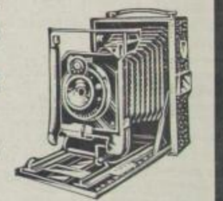
Photo-Spezialgeschäft — | — Katharinenstraße 16