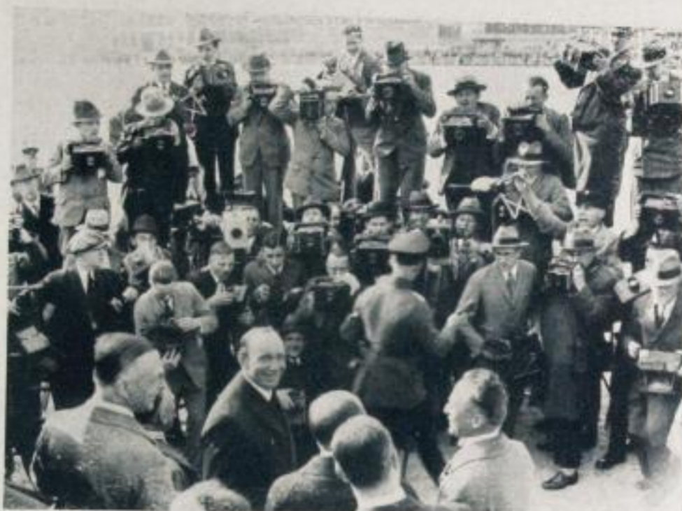
So wurden die Nordpolflieger Wilkins und Bruns von der Meute der Pressefotografen auf dem Berliner Flughafen empfangen. Die Berufsfotografen verfügen über Zeit und beste Apparate. Zwei Stunden nach Ankunft der Flieger veröffentlichten die Zeitungen bereits die Fotografien. — Ein lehrreiches Bild. Denn wo soviel Fotografen hinstürmen (wie bei jeder Sensation) können die Arbeiter-Amateure nicht konkurrieren.

Für den modernen Arbeiter müßte es eigentlich selbstverständlich sein, eine fotografische Kamera mit auf seine Fahrt ins Neue, Unbekannte zu nehmen. Viele haben ja erst beim Wandern Sinn und Möglichkeiten der Kamera erkannt und Lust zum Fotografieren bekommen. Jedenfalls hegen fast alle den Wunsch, einige „Erinnerungsbilder“ von der Reise mit nach Hause zu bringen.