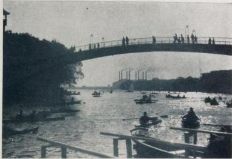
Morgens 6 Uhr

wechelnden Licht- und Schattenpartien des Vorder- und Mittelgrundes, welche durch die ziemlich tiefstehende Sonne hervorgerufen wurden. Es ist dies ein lehrreiches Beispiel für diejenigen, die glauben, mit einer nicht ganz lichtstarken Optik könne man nur in der Mittagszeit gute Aufnahmen machen. Ganz so glücklich ist das Problem des Hintergrundes nicht gelöst. Hier treten durch die nicht lichthoffreie Platte Überstrahlungen und Lichthöfe auf. Eine gute orthochrom-lichthoffreie Platte hätte sie vermieden und ein ganz