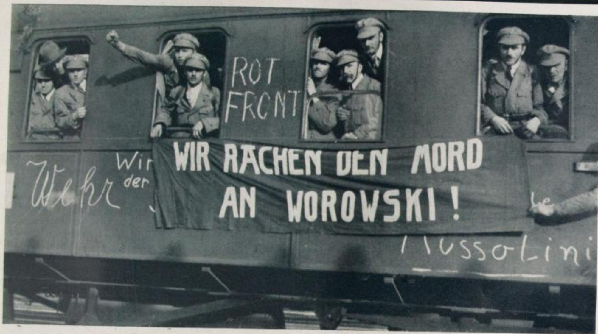
Schweizer Arbeiterschutz-Wehr auf der Fahrt nach Berlin