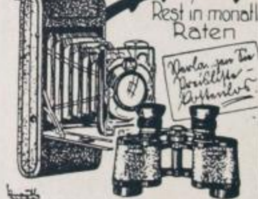
Photo-Spezial-Haus Mittelmann Leipzig C1 / Peterssteinweg 15 Laden, Eingang Härtelstr.

Foto-Apparate von M 1,— an bis zum besten Marken-Apparat. Auf Wunsch Zahlungserleichterung. Unterricht kostenlos. Entwickeln, Kopieren tägl.