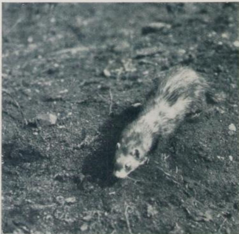
Iltis auf der Fährte

2. Der Kran am Hafen und in der Fabrik vermag nicht minder das Interesse des ernstesten Beschauers hervorzurufen. Er wirkt besonders durch die Linienführung, auf die daher das Hauptaugenmerk des Lichtbildners gerichtet sein muß. Die Komposition muß so gestaltet sein, daß sich der Kran in die Umgebung harmonisch einfügt und deutlich erkennen läßt, was er an der Stelle soll. Eng verwandt mit ihm ist der Sandbagger für Trockenlandschaft. Blicken wir uns weiter in der Schwer- und Eisenindustrie um, so werden unsere Blicke auf den