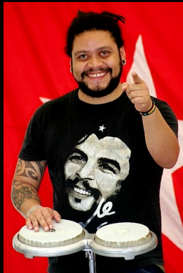
Arbeiterfotografie-Workshop Reportagefotografie / Ergebnisse auf der photokina