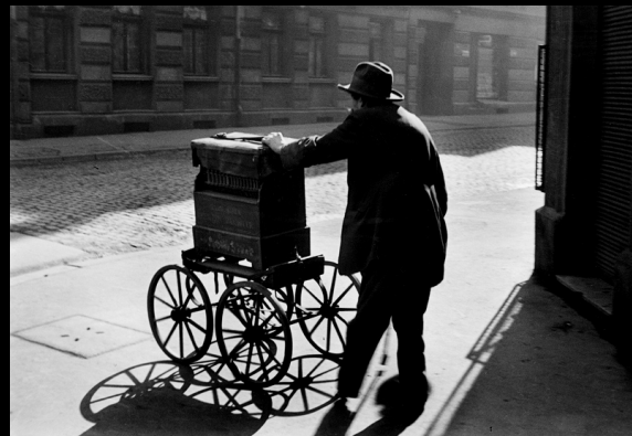
Walter Ballhause Der unsichtbare Fotograf