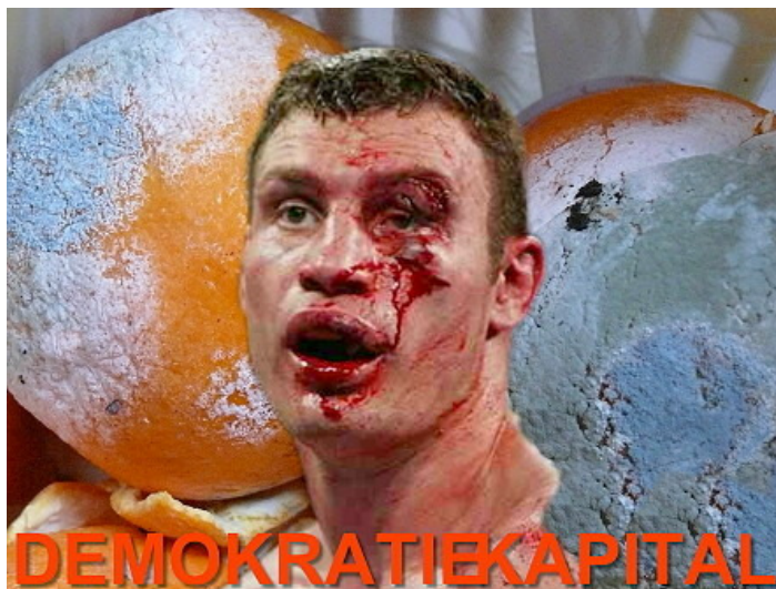
Vitali Klitschko – das „DemokratieKapital“ für die neue Orange Revolution

In der Tradition der Arbeiterfotografie-Bewegung der Weimarer Republik, die vom deutschen Faschismus verboten wurde, sehen wir uns verpflichtet, Einhalt zu gebieten und zum eigenständigen und kritischen Denken aufzurufen! Die so genannte Freiheitsbewegung der Ukraine ist die Freiheitsbewegung des westlichen Kapitalismus und Militarismus im Kampf um neue Märkte und Einflussphären. Mit wirklicher Freiheit hat dies nichts zu tun. (af/gw)