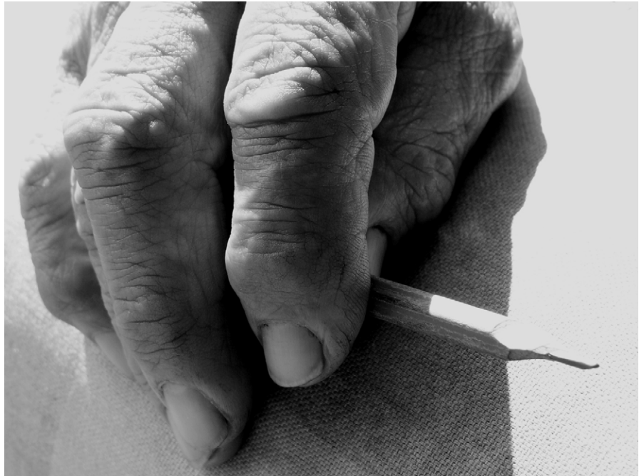
Diogenes aus Köln-Nippes - obdachloser Künstler

Alle, die gern fotografieren, sind eingeladen, sich an unserem Jahresthema »Licht und Schatten des Alltags« zu beteiligen. Es können Einzelfotos, Serien, Montagen, Collagen oder Plakate eingereicht werden